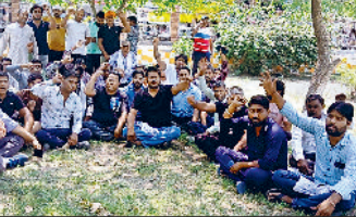
मिवानी। पार्क में धरने पर बैठे आरओ प्लांट संचालक।

दूसरी तरफ जिला प्रशासन के नोटिसों के विरोध में आरओ संचालक हड़ताल पर चले गए। उन्होंने चेतावनी दी कि जब तक उनकी मांगों को पूरा नहीं किया जाता। तब तक उनका आंदोलन