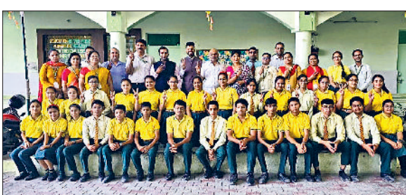
मिवानी। स्कूल प्रबंधक के साथ बोर्ड परीक्षा में उत्कृष्ट प्रदर्शन करने वाले विद्यार्थी।