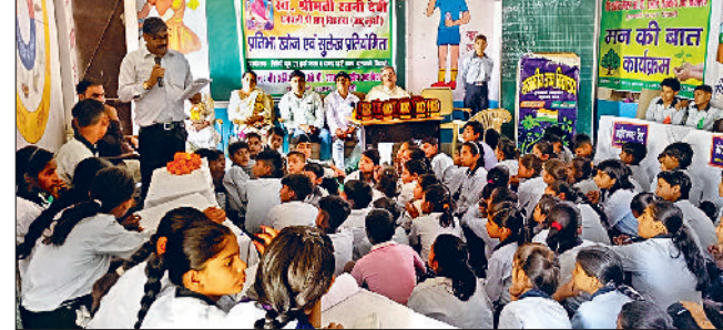
मिवानी। आयोजित क्वीज प्रतियोगिता बच्चों से सवाल पूछते हुए तथा प्रतिभागियों को पुरस्कार देकर सम्मानित करते हुए।