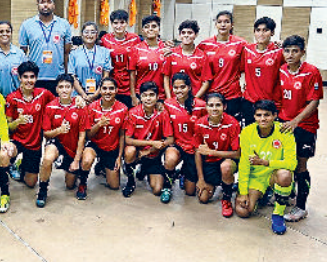
बवानीखेड़ा। वेस्ट बंगाल को फैनल्टी शूट आउट में 4.3 के अंतर से पराजित करने पर खिलाड़ी।