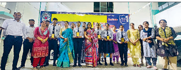
तोशाम। मेधावी विद्यार्थियों को सम्मानित करते अतिथि।